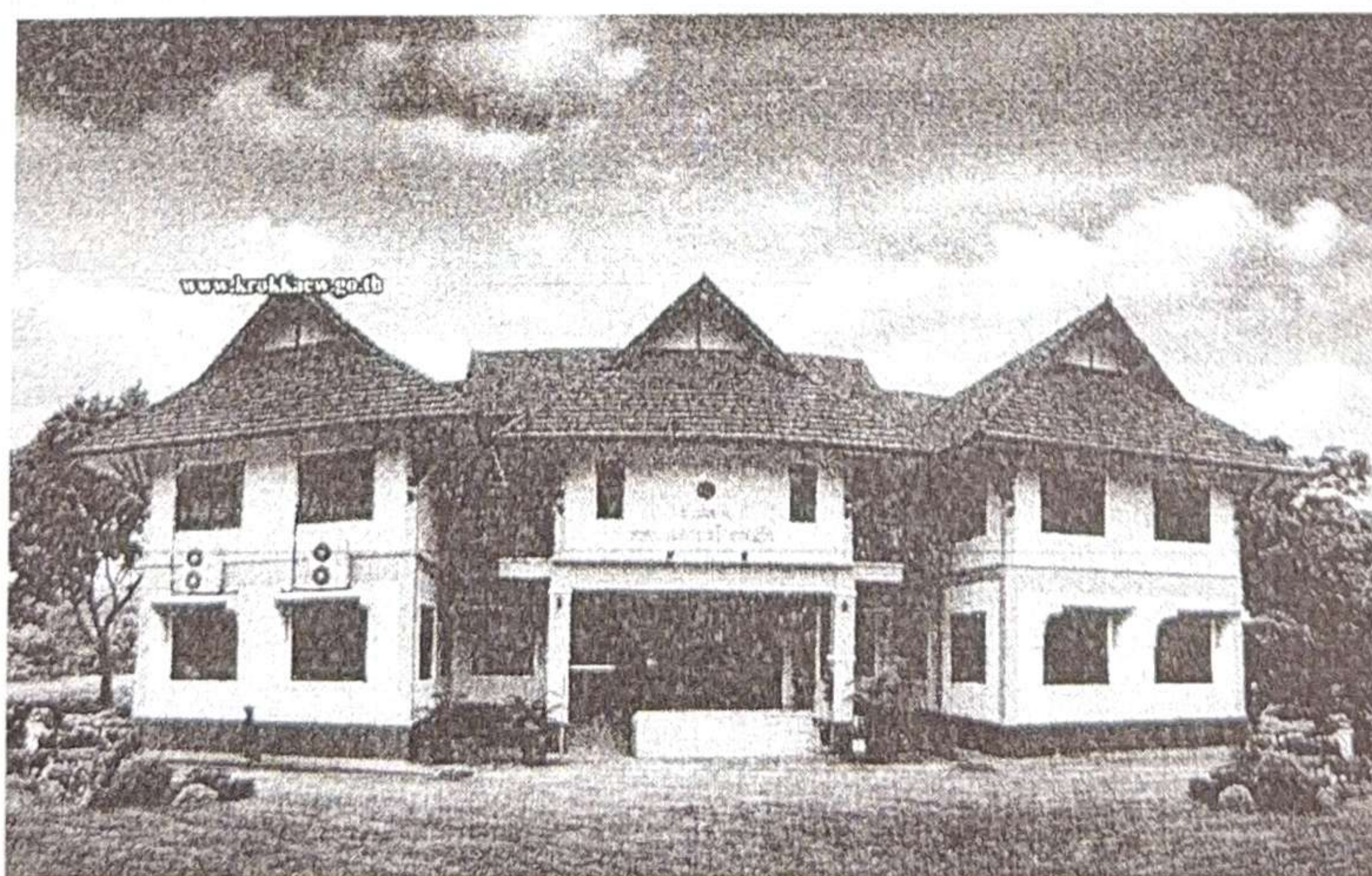
เทศบาลตำบลโกรกแก้ว อำเภอโนนสุวรรณ จังหวัดบุรีรัมย์