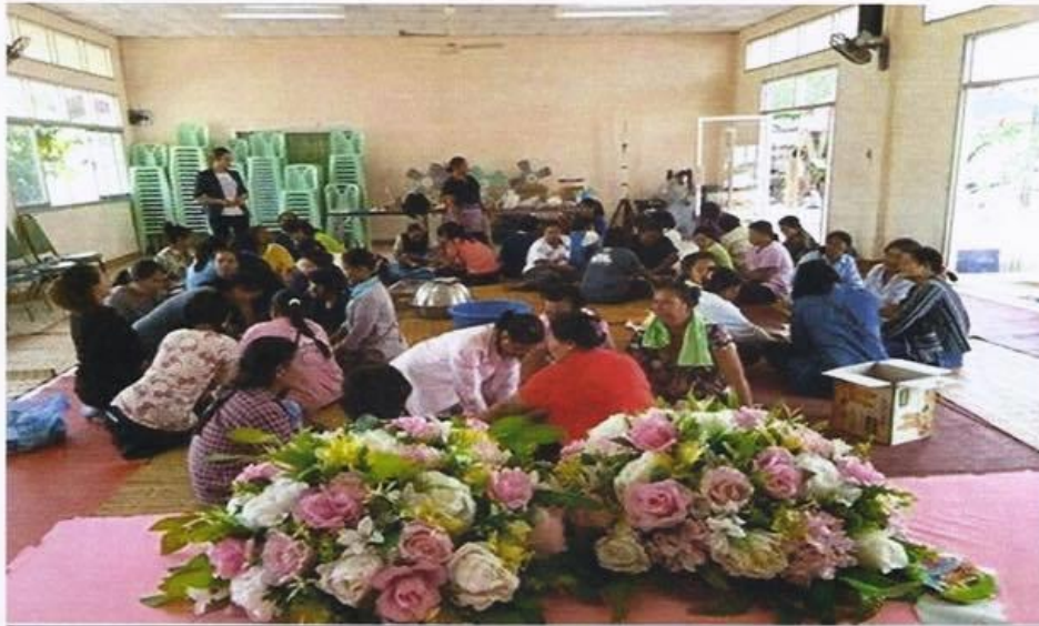
รูปภาพโครงการฝึกอบรมอาชีพการทำขนมเครื่องสำอางในตำบลโกรกแก้ว ประจำปีงบประมาณ ๒๕๖๐

***โครงการฝึกอบรมอาชีพการทำขนมเครื่องสำอางในตำบลโกรกแก้ว***